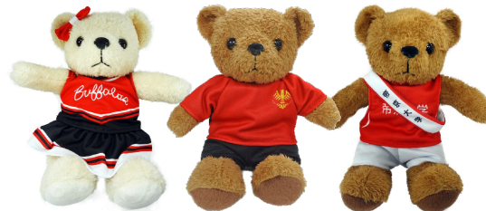
チアリーディング部 ラグビー部 駅伝部

マスコットテディベアにユニフォームを着せました。テディベアは手作りなので、ひとつひとつ表情が違います。