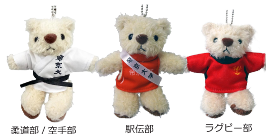
柔道部 / 空手部